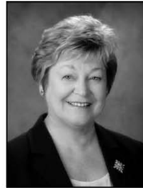
L'honorable Barbara A. Hagerman Lieutenant-gouverneure de l'Île-du-Prince-Édouard